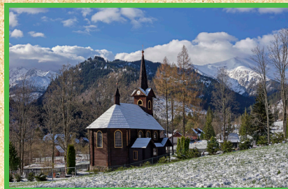
Kostol svätej Anny St. Anne's Church