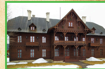
Polovnícky zámoček Hohenlohe - súčasť Významného lesníckeho miesta Hohenlohe hunting lodge - part of the forestry site