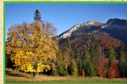
Belianske Tatry v jesennom šate The Belianske Tatra Mts. in autumn